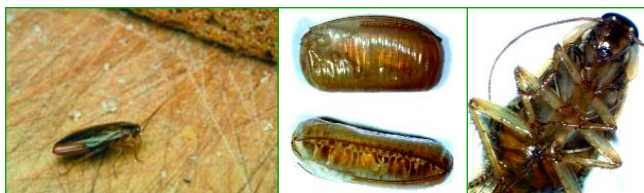
Deutsche Schabe, Eipakete einer Küchenschabe, Küchenschabe sciencephoto/contrast, MA 38 (2)

Fraß- und Kotspuren an Lebensmitteln, Bucheinbänden und Textilien. Befallene Vorräte riechen unangenehm. Häutungsreste können allergen wirken. Schaben können Krankheitserreger übertragen. Bei Tag sichtbare Tiere deuten auf starken Befall hin.