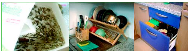
Mottenfalle mit Pheromonen aufstellen, Tieren den Zugang zu Lebensmitteln erschweren Konecky (3)