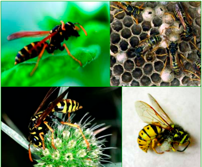
Begsteiger KEG, Schatten (2), Konecky

Hornissen leben ähnlich wie Wespen. Sie sind sehr friedfertig und scheu und kommen im Gegensatz zu Wespen nicht zum Essplatz. Da sie schon selten geworden sind, stehen sie unter Naturschutz. Ihre Nester dürfen nicht zerstört werden, sondern müssen nach Möglichkeit von Fachpersonal umgesiedelt werden. Stiche von Hornissen sind nicht so gefährlich wie oft behauptet wird.