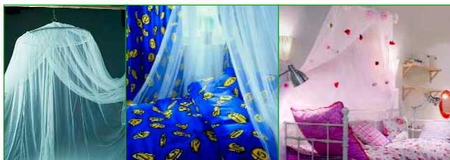
Moskitonetze als Dekorationselemente