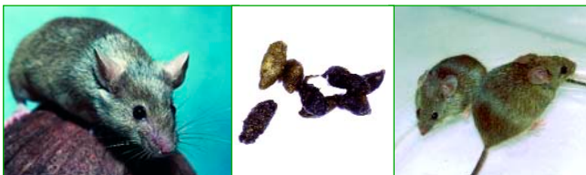
Mäuse und Mäusekot

dunkelgrau bis bräunlich, 8–10 cm groß, Schwanz genauso lang wie Körper