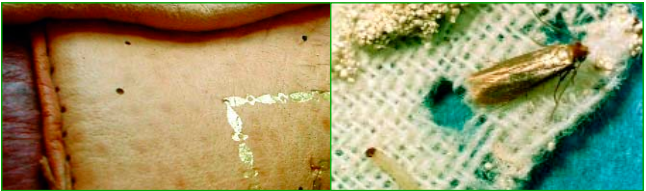
Fraßspuren an Leder, Textilmotte mit Raupe und Gespinst

Textilschädlinge fressen tierische Fasern wie Wolle, Federn und Pelze und verursachen Schäden an Kleidung, Pelzen und Wollteppichen. Kunstfasern und Pflanzenfasern wie Baumwolle u.ä. fressen sie nicht, wohl aber Mischgewebe mit über 20% Wollgehalt. Kleidungsstücke und andere Produkte aus reiner Wolle sind meist chemisch gegen Motten- und Käferfraß gerüstet. Die Fasern sind fix mit Chemikalien verbunden, die sie für den Schädling ungenießbar machen. Zu den häufigsten Textilschädlingen zählen Kleidermotten, Pelzkäfer und Teppichkäfer.