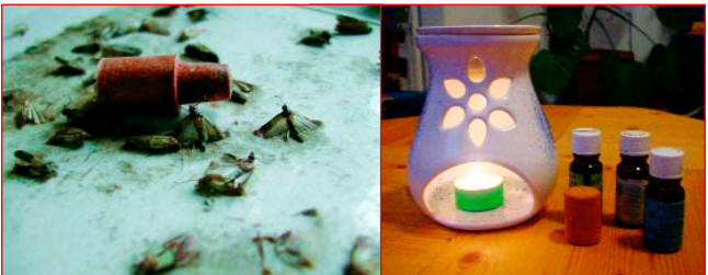
Ungiftige Schädlingsbekämpfung mit ätherischen Ölen oder Pheromon-Fallen.

Oft sind die Bekämpfungsmittel gefährlicher als der Schädling selbst. Es sollten nur Mittel zum Einsatz kommen, die für Mensch und Haustier ungefährlich sind. Insektengifte setzen sich in Möbeln, Teppichen, Tapeten und Stofftieren fest. Sie werden dann langsam wieder an die Raumluft abgegeben und belasten die Gesundheit über einen längeren Zeitraum. Giftige Mittel sollten professionellen SchädlingsbekämpferInnen vorbehalten und nur dann eingesetzt werden, wenn durch starken Befall beträchtlicher Schaden oder Belästigungen zu erwarten sind.